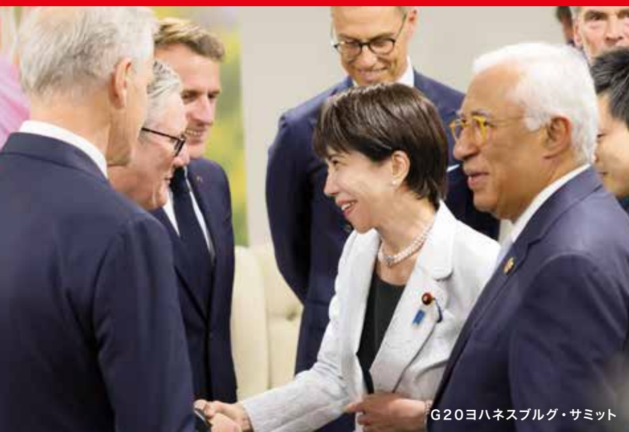
G20ヨハネスブルグ・サミット