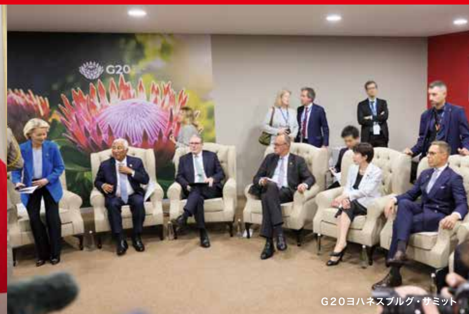
G20ヨハネスブルグ・サミット