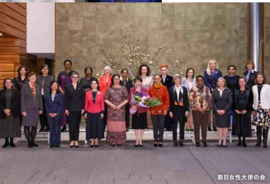
駐日女性大使の会